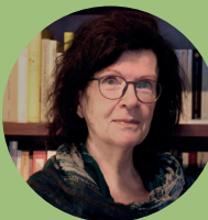
CAROLA CLASEN „Queen of Eifel-Crime“